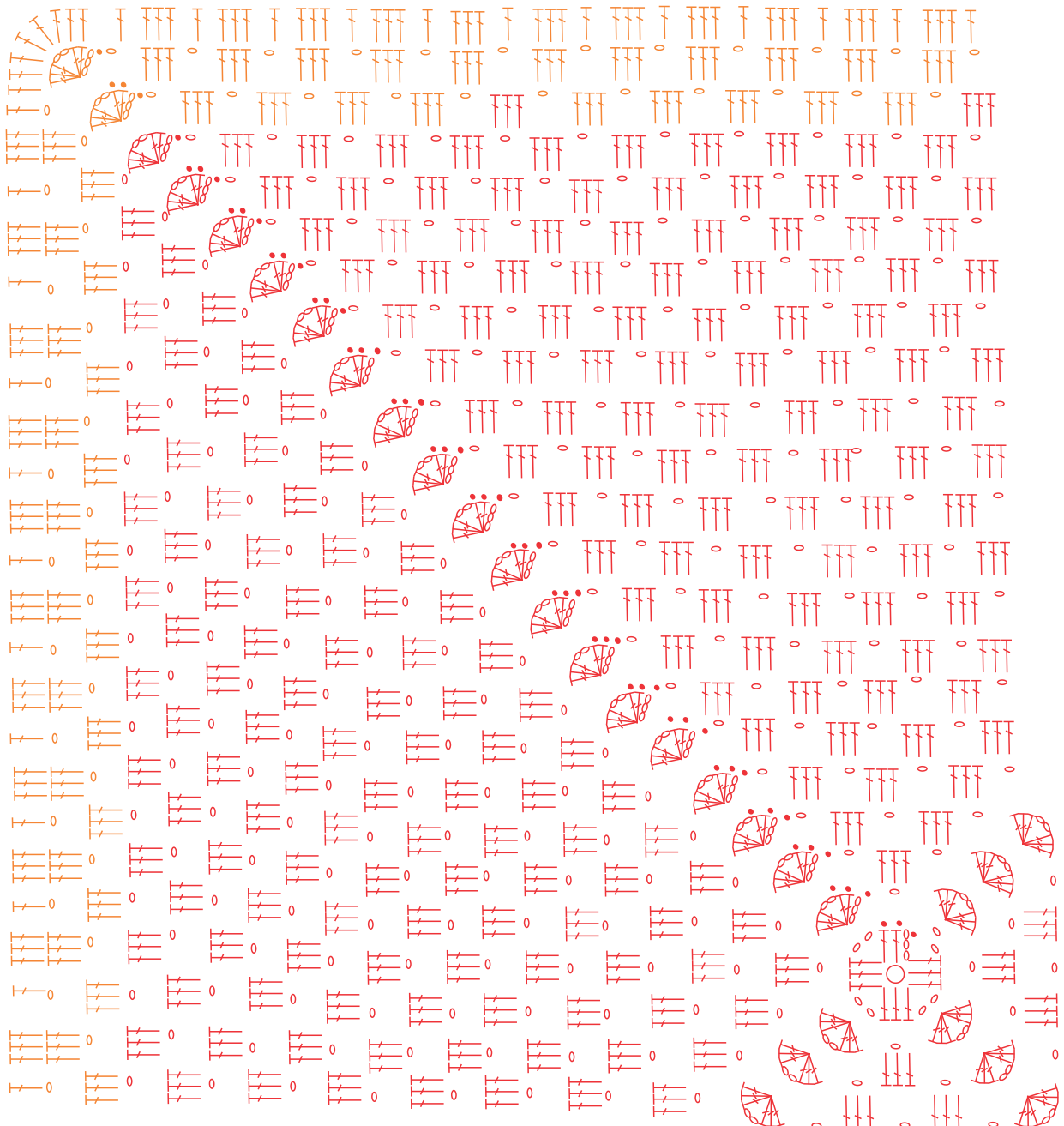
Gráfico 2 - Parte de Trás